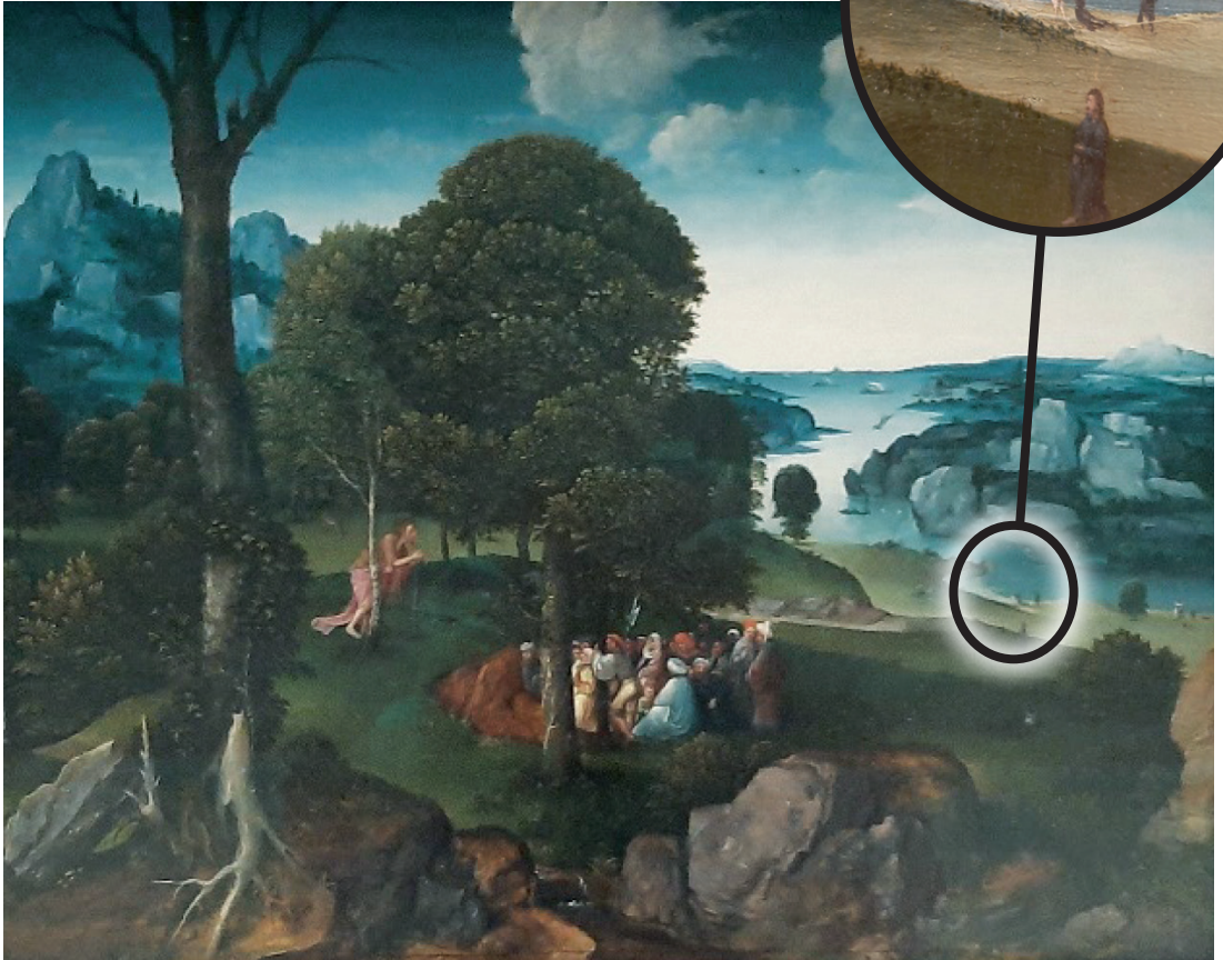
3. Joachim Patinir, De doop van Jezus (Koninklijk museum voor Schone Kunsten, Brussel)

luisteren naar een man. Die wijst met zijn vinger in de verte. Als je verder inzoomt op de rivier, dan is daar opeens een figuur met een stralenkrans zichtbaar. In een nog kleiner detail op het schilderij zien we de doop van Jezus in de Jordaan. Er vliegt boven zijn hoofd een duif, symbool voor de Heilige Geest. De man onder de