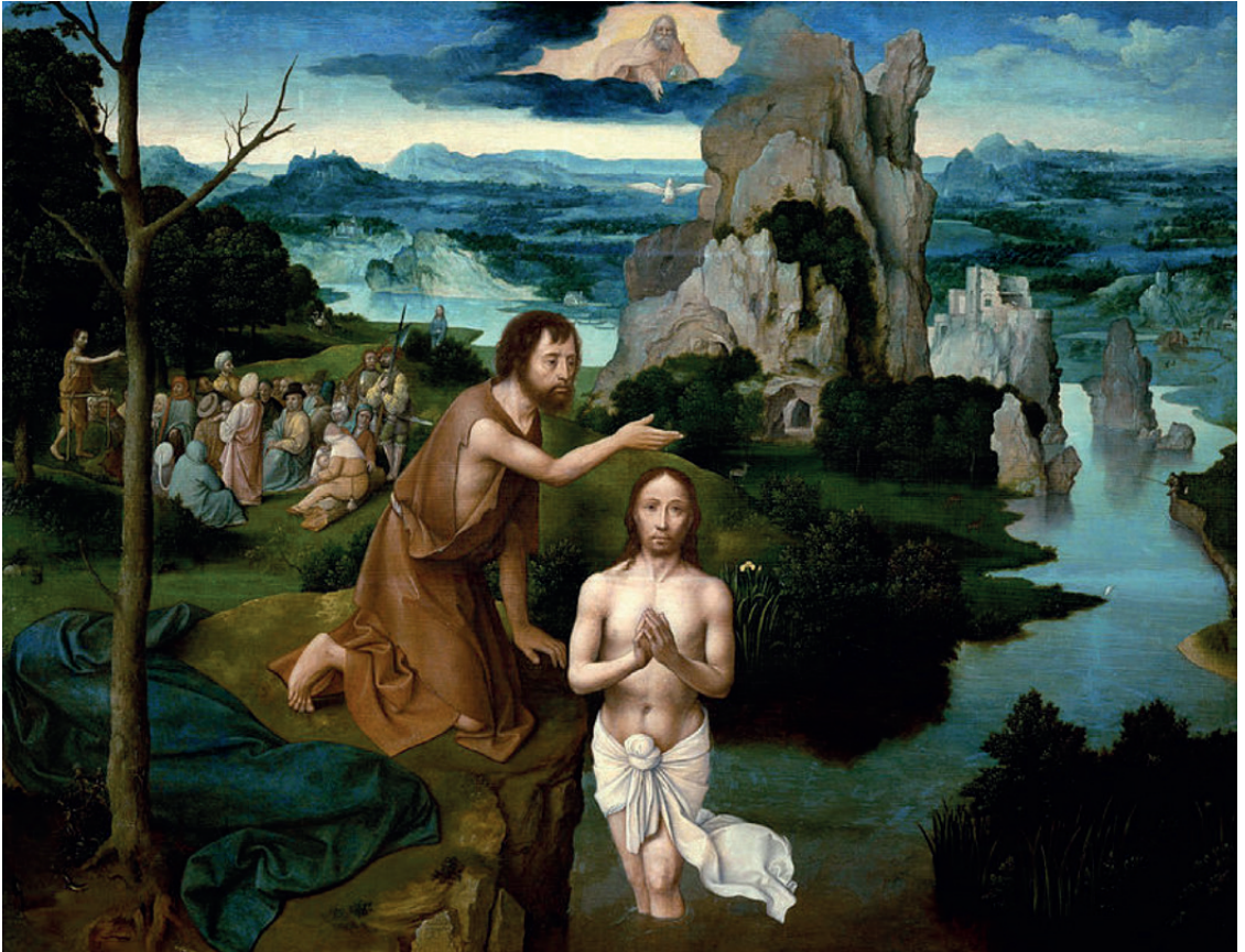
2. Joachim Patinir, De doop van Jezus (Kunsthistorisch museum, Wenen)

Joachim Patinir (1485-1524) was één van de leerlingen van Gerard David. Patinir heeft in zijn korte leven een nieuw genre gecreëerd namelijk: landschapschilderijen. Als eerste wil ik een schilderij van hem tonen. Daarop is duidelijk de invloed van zijn leermeester zichtbaar. Op dit schilderij (foto 2) is de doop van Jezus ook op de voorgrond