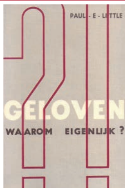
Geloven - waarom eigenlijk? Paul E. Little